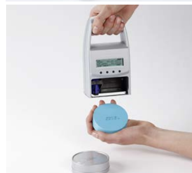
1. Imprimare pe metal și plastic